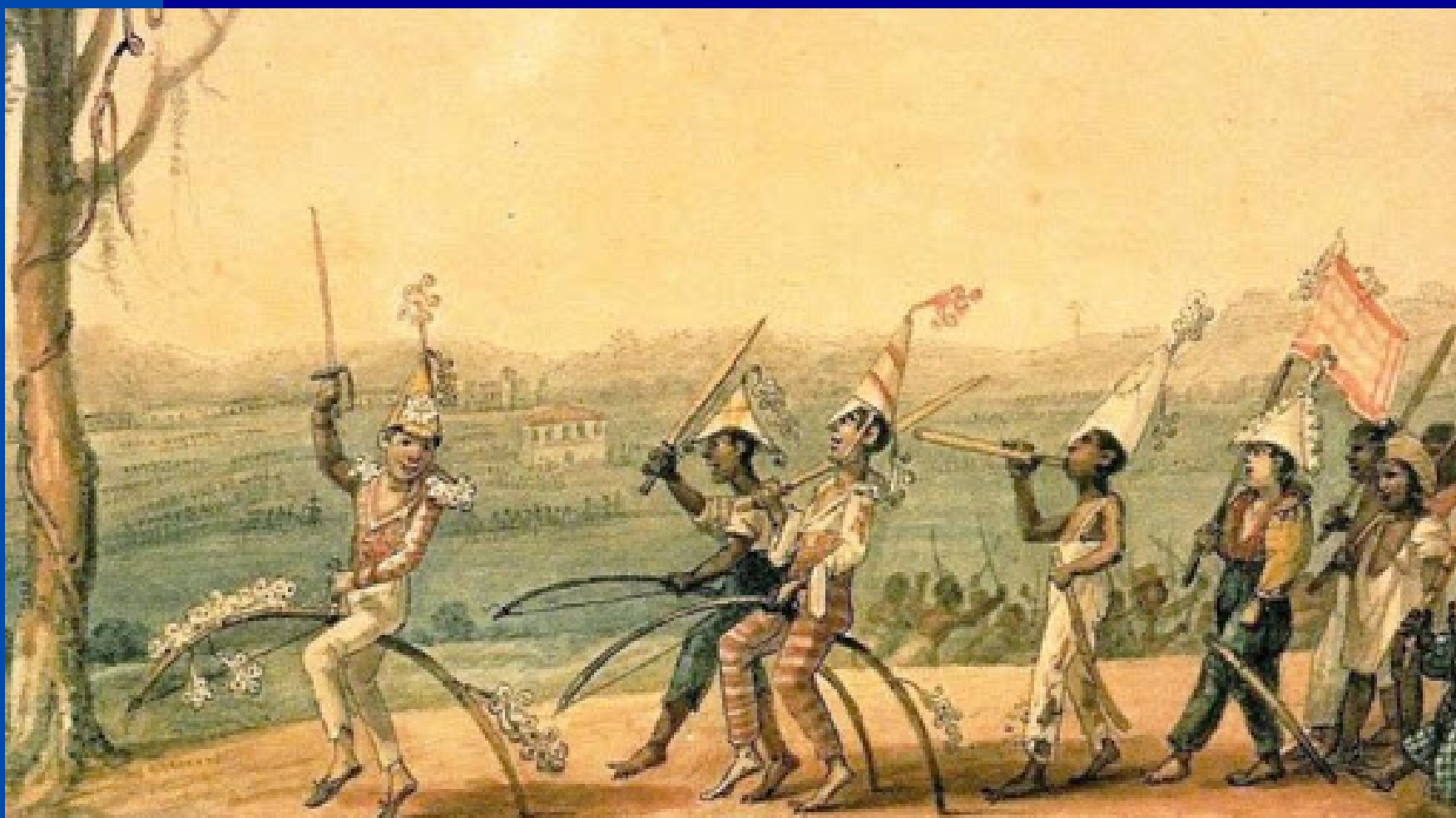
Jean-Baptiste Debret, 1827

https://arteeartistas.com.br/carnaval-jean-baptiste-debret-origem/