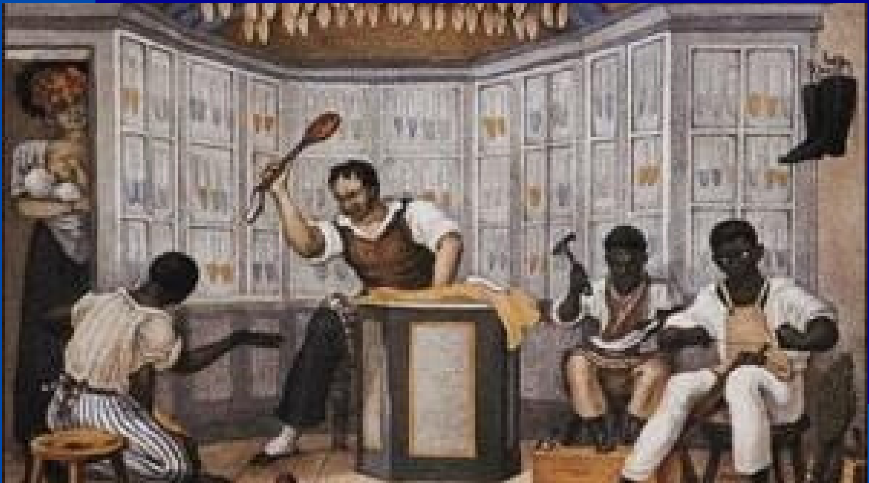
Jean-Baptiste Debret, 1835

https://historiahoje.com/trabalho-infantil-castigos-e-obrigacoes/