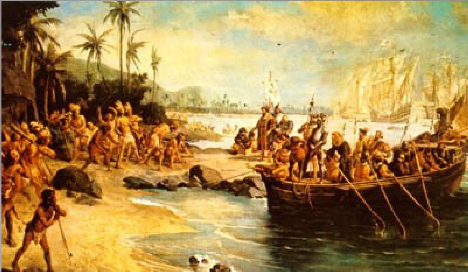
Oscar Pereira da Silva, Desembarque de Cabral em Porto Seguro, SP , Museu Paulista

http://www.multirio.rj.gov.br/historia/modulo01/desc_brasil.html